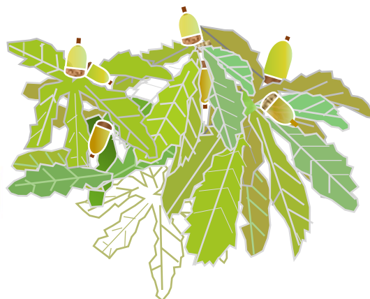
ドングリ いくつあるかな？

今月、彼岸入りになると、まるで言い合わせたように急に気温が下がって、その変化に体調を崩した人も多かったようです。